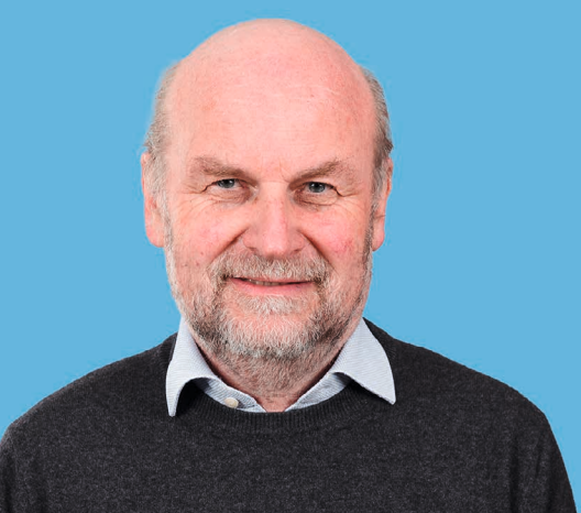
Ludwig Moroder, 72